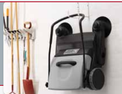
Il manico pieghevole consente di appendere la macchina al muro tramite un gancio senza che fuoriescano detriti dal contenitore rifiuti.