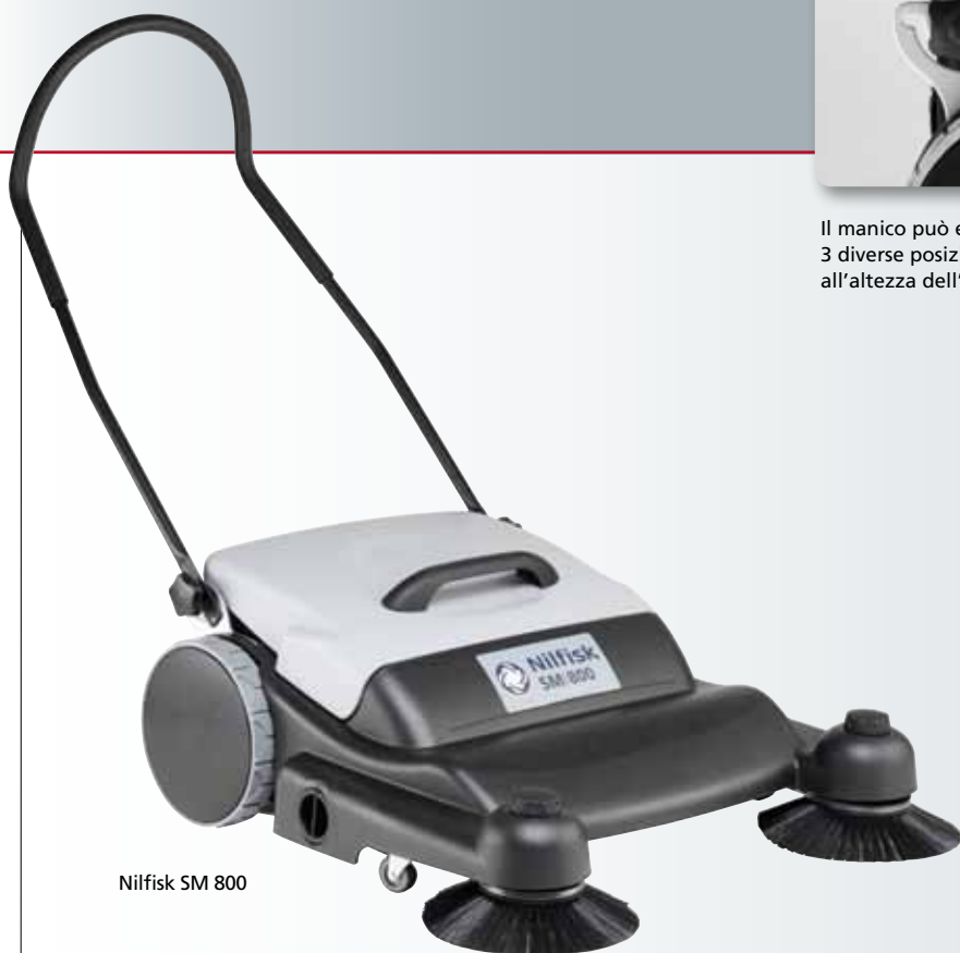
Nilfisk SM 800

La combinazione delle spazzole laterali con le spazzole principali garantisce una maggiore efficienza della macchina, che risulta essere 5 volte più produttiva della spazzatura manuale, risparmiando tempo e denaro. Il contenitore rifiuti è molto leggero e dotato di una maniglia posta all'esterno per una più facile apertura. La SM 800 permette di mantenere l'ambiente pulito e curato con costo e sforzo minimi.