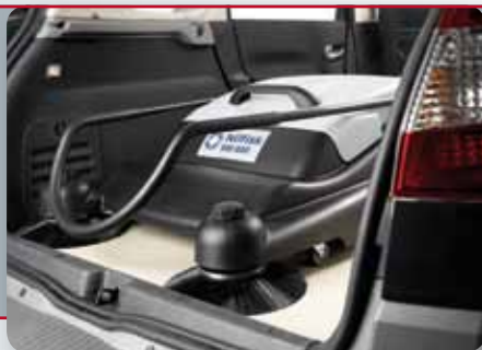
Il manico pieghevole consente un facile trasporto e un facile stoccaggio della macchina.