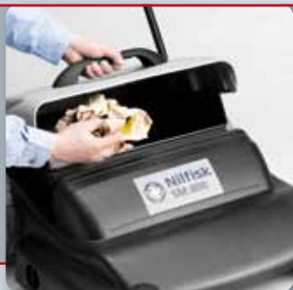
Il contenitore rifiuti può restare parzialmente aperto per facilitare l'introduzione di detriti di grandi dimensioni.